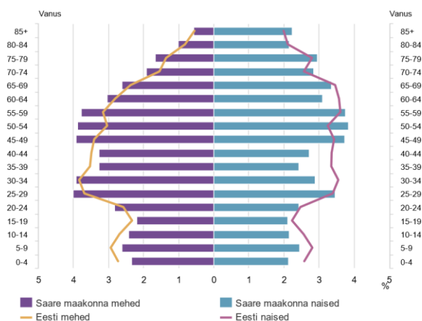
Saare maakonna rahvastikupüramiid, 1. jaanuar 2018